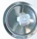
Tappo per alte temperature T200