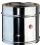
Elemento prelievo fumi monoforo