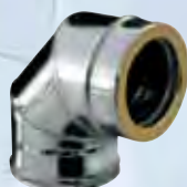
Gomito a 90°