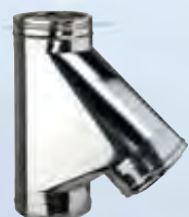
Raccordo a T 135°