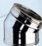
Gomito a 30°