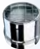
Griglia per aria di compensazione