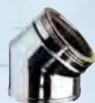
Gomito a 45°