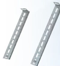
Prolunghe per fascetta a muro