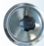
Tappo per alte temperature T600