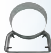
Fascetta / collare a muro regolabile 50 - 80 mm