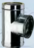
Raccordo a T 90°