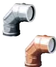
Gomito a 87°