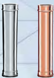
Elemento lineare 1000 mm