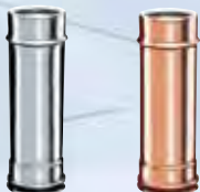
Elemento lineare 500 mm