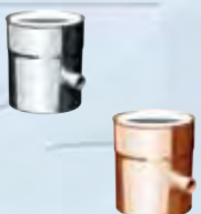
Elemento prelievo fumi monoforo