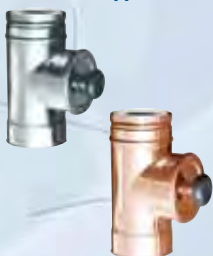
Elemento ispezione con tappo