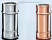
Elemento lineare 250 mm