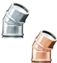
Gomito a 30°