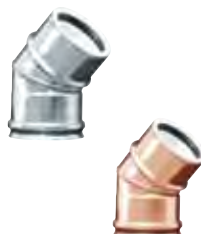
Gomito a 45°