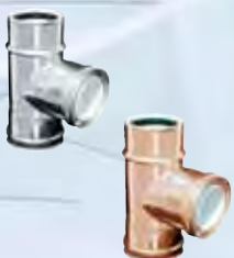
Raccordo a T 87°