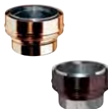
Adattatore mono (M) doppia parete (F) rame | arabescato