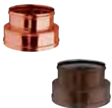
Adattatore doppia (M) monoparete (F) rame | arabescato