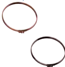
Fascetta di chiusura / bloccaggio elementi rame | arabescato