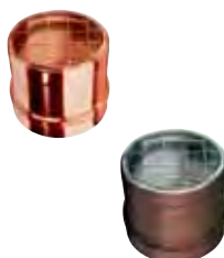
Griglia per aria di compensazione rame | arabescato