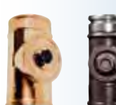
Elemento ispezione con tappo rame | arabescato