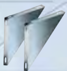
Coppia spalle supporto a muro inox