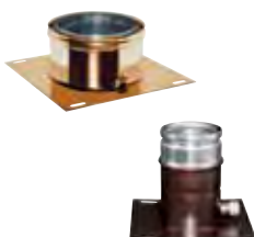
Piastra ancoraggio con drenaggio laterale rame | arabescato