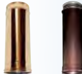
Elemento lineare 500 mm rame | arabescato