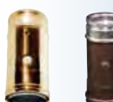
Elemento prelievo fumi monoforo rame | arabescato