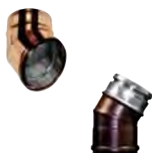
Gomito a 30° rame | arabescato