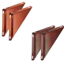
Coppia spalle supporto a muro rame | arabescato