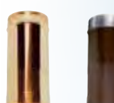
Elemento telescopico/ regolabile 260 - 390 mm rame | arabescato