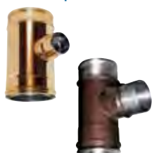
Raccordo a T 90° derivazione 80 mm monoparete rame | arabescato