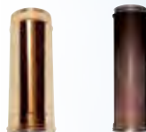
Elemento lineare 1000 mm rame | arabescato