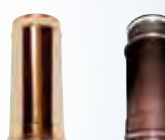
Elemento lineare 250 mm rame | arabescato