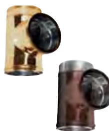
Raccordo a T 90° rame | arabescato