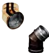
Gomito a 45° rame | arabescato