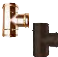
Raccordo a T 90° derivazione 80 mm coibentata aria rame | arabescato