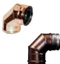
Gomito a 90° rame | arabescato