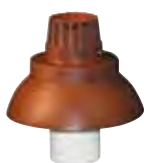
Terminale parapioggia marrone h 200 mm