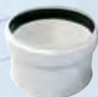
Tappo cieco per ispezione