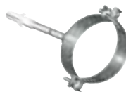
Fascetta a muro inox con tassello