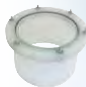
Raccordo mono - flex