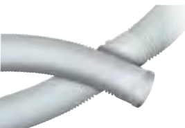
Flex in spezzoni A misura