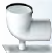
Curva base con staffa