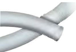
Flex in rotoli Rotolo singolo