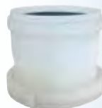
Raccordo flex - mono