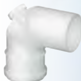
Gomito a 87° ispezionabile