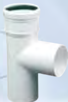
Raccordo a T 90°