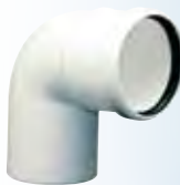
Gomito a 87°