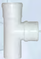
Elemento ispezione intermedio