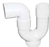
Sifone scarico condensa universale