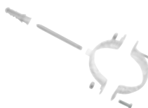
Collare di staffaggio a muro verniciato bianco