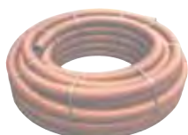
Tubo flessibile PVDF