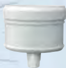
Tappo scarico condensa