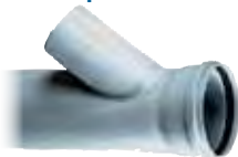
Raccordo a T 135° per collettori